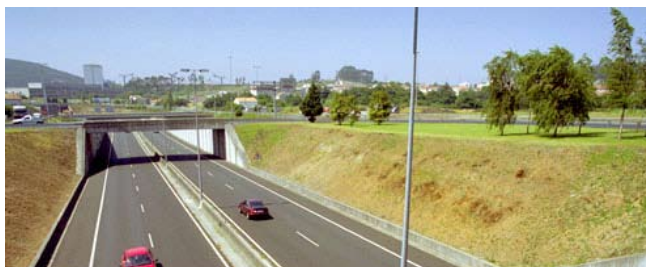
Acceso por estrada

Autopista do Atlántico AP-9 Autovía do Noroeste A-6 Autovía das Rías Baixas A-52. Autoestrada AP-53