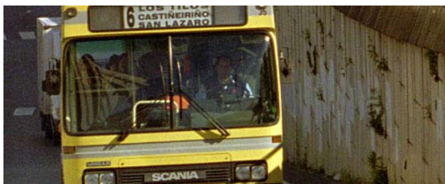
Estación de autobuses de Santiago de Compostela

Situación: San Caetano, s/n Tel: 981 54 24 16