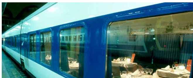
Estación de tren de Santiago de Compostela

Situación: C/ HÓRREO, S/N Tel: 902 24 02 02 / 981 59 18 59