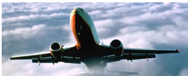
Aeroporto de Santiago de Compostela

Situación: Lavacolla Distancia: 10 KM (15 min. en coche) Tel: (+34) 981 54 75 00 / (+34) 981 54 75 01